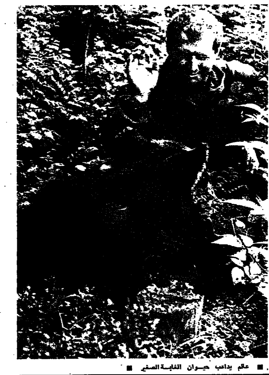
عالم يداعب حيوان الغاية الصغير

على الخط الفاصل بين جياه نهري الغولف والحقينا الغربي ، تقع مملكة نباتية وحيوانية ، غنية ومتنوعة . جبالها الحجرية التقنية صيحتها الانسان وتبدو مثال الطبيعة المعزاة . تظن فيها حيوانات الجبال : الدب ، الضفدع ، الثعلب ، الفهد والنمس ، كما يقطن الابل وحيدا ، وهو اكبر حيوانات الغاية . من متنوعات والمعلماء الروس يدرسون هذا الوسط الطبيعي ، وهدى مملكة عناصره المتكاملة بالبيئة الواحدة .